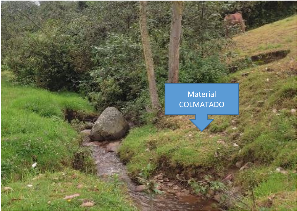
FIGURA N°02: MARGENES COLMATADOS DE LA QUEBRADA PACHCHACA